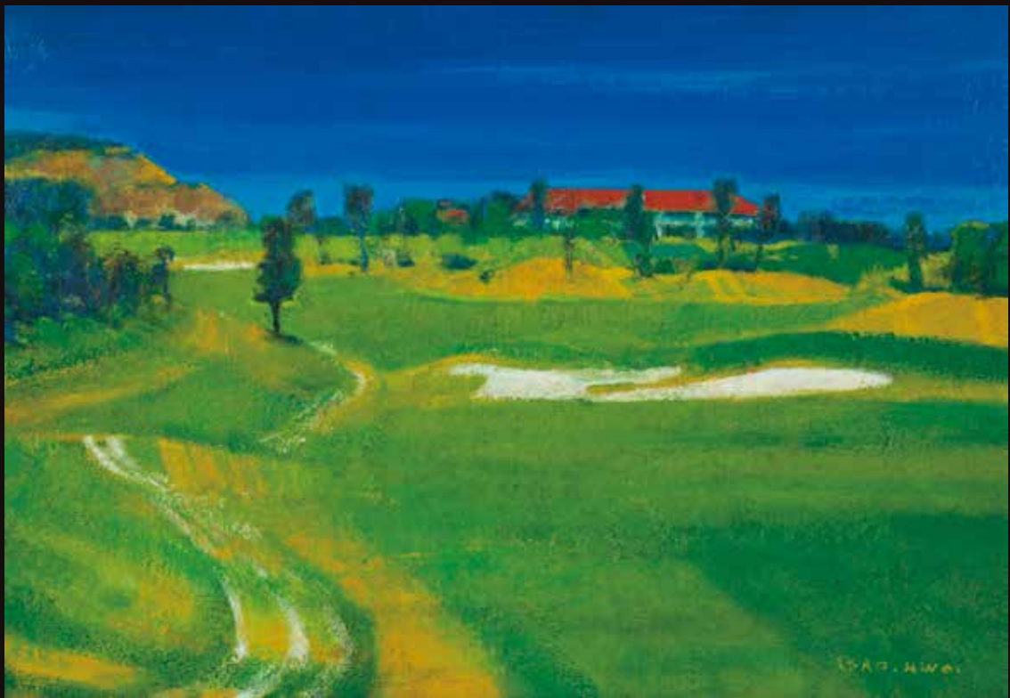
「バンカーのある風景」