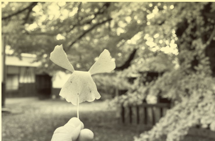
童心に返りイチョウの落ち葉でトッポジージョを作ってみました＝11月16日、瑞応寺

紅葉の季節。大銀杏樹（おおいちょうじゅ）は色づいているだろうか、11月11日に新居浜市山根町の瑞応寺を訪ねました。県指定天然記念物でもある大木の葉はまだ黄緑色。散歩中のおばあさんは「あと1週間くらいかのう」と言います。5日後に再び山門をくぐってみると、完全には色づいていませんでしたが、落葉も始まっており、秋の深まりをそれなりに感じることができました。庭一面に黄色いじゅうたんを敷き詰めた様は、さぞかし風情があるのだろうと想像します。掃除は大変でしょうけれど。