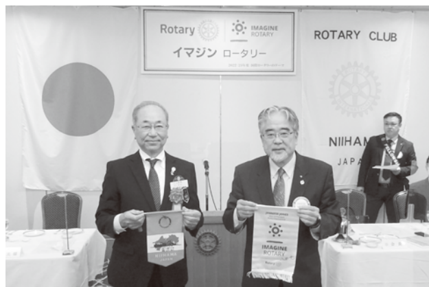
■ 11月10日 ガバナー公式訪問 ■