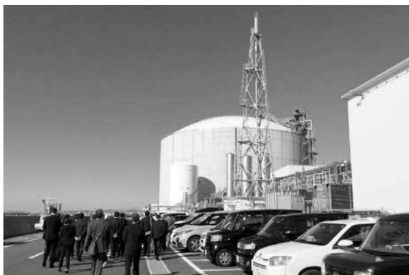
新居浜LNG株式会社へ到着

その後バスに乗り込み住友化学(株)愛媛工場新居浜地区構内の新居浜LNG株式会社へ行きました。