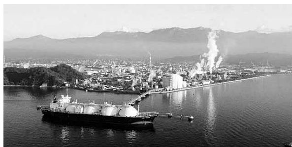
HPよりLNG船が到着した写真