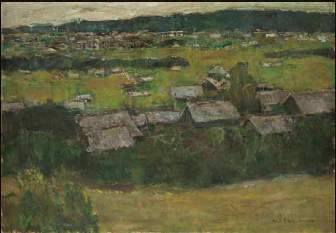
「新居浜の街の見える風景」