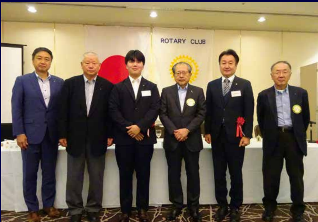
10月5日 米山奨学生来訪