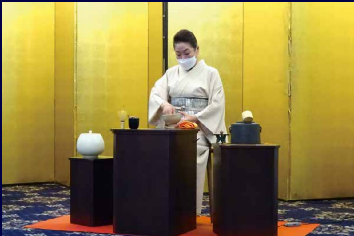
4月11日 お茶の会 (リーガロイヤルホテル新居浜)