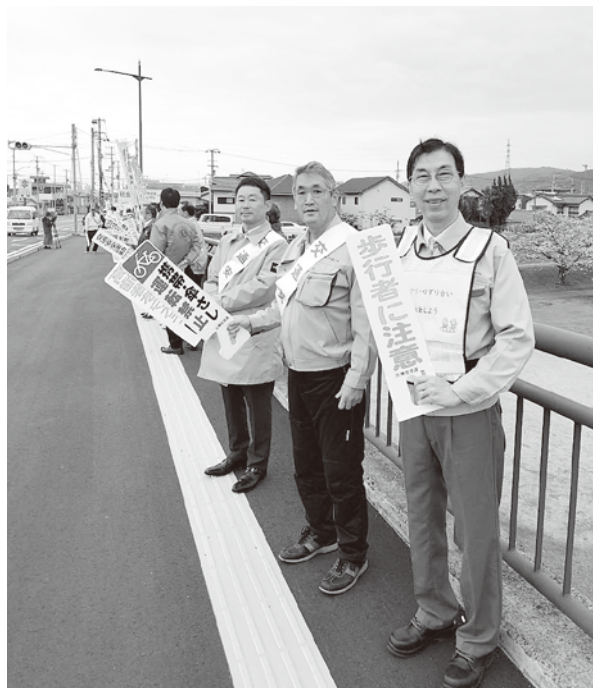
春の全国交通安全運動 人の輪作戦（平和通り 平形橋）