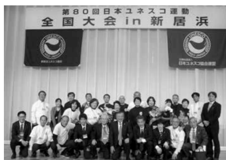
第80回日本ユネスコ運動全国大会 in 新居浜 (2024年11月23日(土))

主な事業としては、「平和に鐘を鳴らそう事業」がございます。毎年8月の第一もしくは第二土曜日に開催しており、これまでイオンモール新居浜サウスコートで合唱や書道パフォーマンスなどを交えておりました。今年は趣向を変え、8月6日の広島平和記念日に、めぐみ保育園さんに出向き幼い子供たちと一緒に世界平和を祈りました。また、日本の文化である落語を子供たちに披露する「ユネスコ寄席」も行なっており、今年度は市内小学校2校と中学校に出向く計画です。その他にも、新居浜高専の留学生との交流などの国際交流活動、そして書き損じハガキによる世界寺子屋運動にも積極的に取り組んでおります。