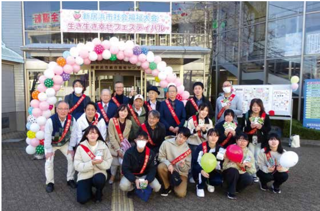
11月30日 花の種配布（新居浜市総合福祉センター）