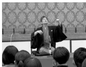
ユネスコ寄席(大生院中)