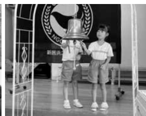
平和の鐘(めぐみ保育園)

主な事業としては、「平和に鐘を鳴らそう事業」がございます。毎年8月の第一もしくは第二土曜日に開催しており、これまでイオンモール新居浜サウスコートで合唱や書道パフォーマンスなどを交えておりました。今年は趣向を変え、8月6日の広島平和記念日に、めぐみ保育園さんに出向き幼い子供たちと一緒に世界平和を祈りました。また、日本の文化である落語を子供たちに披露する「ユネスコ寄席」も行なっており、今年度は市内小学校2校と中学校に出向く計画です。その他にも、新居浜高専の留学生との交流などの国際交流活動、そして書き損じハガキによる世界寺子屋運動にも積極的に取り組んでおります。