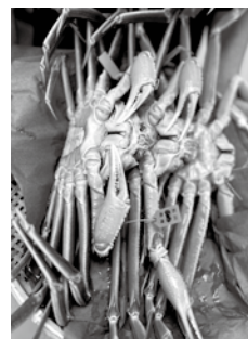
近江町市場のカニ

2日目は近江町市場での買い物、ひがし茶屋街での昔ながらの建物の雰囲気の通りを散策しました。こちらでお買い物をされた方も多かったのではないかと思います。お昼はかなざわ石亭でしゃぶしゃぶのコースをいただきました。みなさん食べきれないほどの料理が出てきましたが、非常においしかったです。