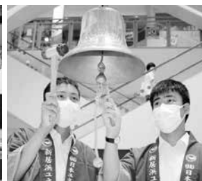
平和の鐘(新居浜南高生)