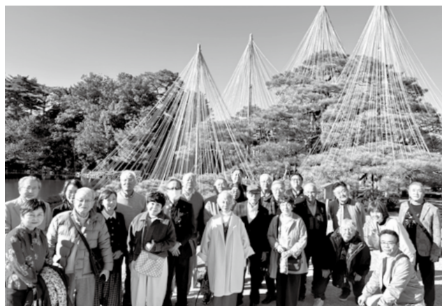
集合写真（兼六園にて）

今回の旅行では乗り換えも多く、電車ということもあり、おもてなしが行き届かず申し訳ありませんでした。普段飲まない量のお酒で酔ったため迷惑をおかけしたかもしれませんが、多くのニコニコもいただき感謝しております。後期も親睦家族会という大きな行事がありますので、皆様と一緒に盛り上がるようにご協力をお願いいたします。