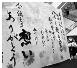
平和の鐘(書道パフォーマンス)

次に、私が会長を務めさせていただいております新居浜ユネスコ協会についてご説明いたします。当協会は2004年9月11日に設立され、賛助会員57社、個人会員67名で構成されております。