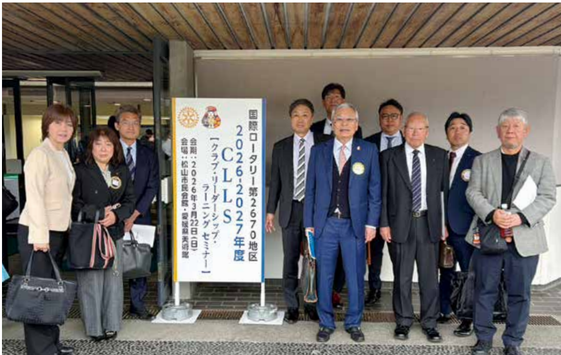
3月22日 クラブ・リーダーシップ・ラーニング セミナー (松山市民会館・愛媛県美術館)